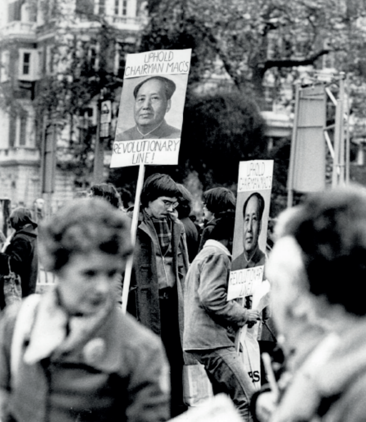
Brittiska maoister under 70-talet